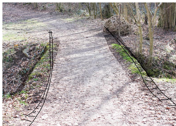
ponti e pensieri